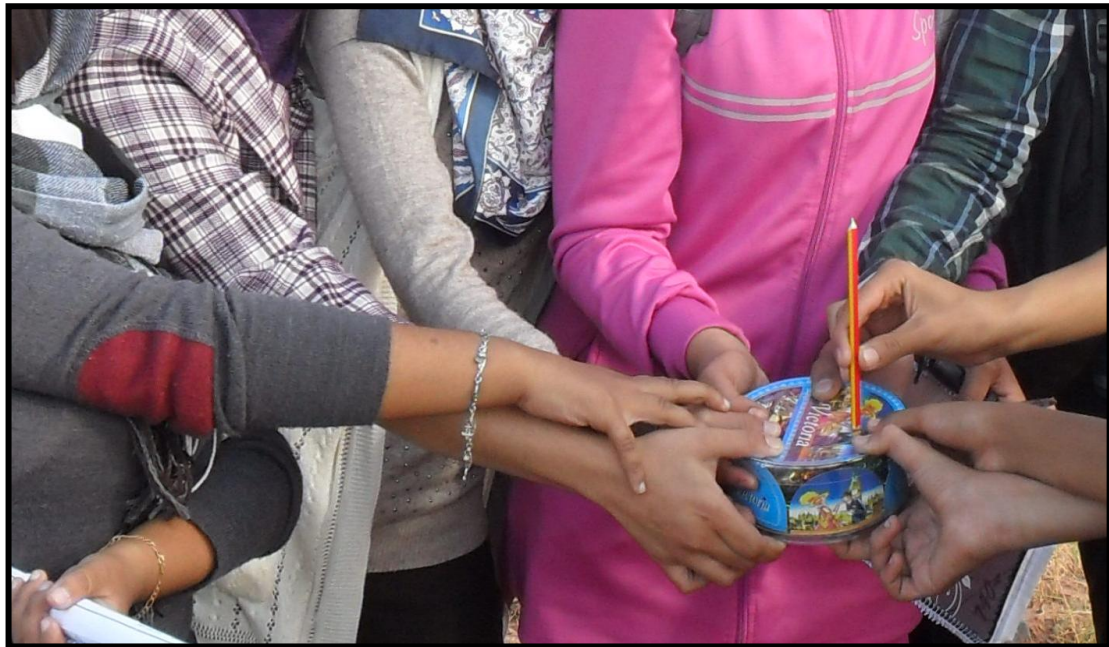
فريق « la nature » الفائز بالمسابقة

✽ اختتمت الدراسة الميدانية بمسابقة، تم من خلالها إنجاز تقويم مبسط للمعارف والمهارات التي تم إدراجها في فقرات هذه الخرجة (انظر النموذج)، حيث توجت بتقديم هدية رمزية للفريق الفائز (فريق الطبيعة « la nature »)